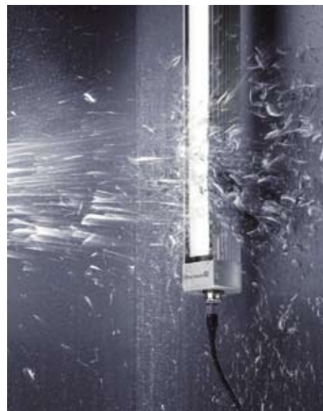
Abb. 2: Eingebaut in Maschinenräume müssen die Leuchten hohen mechanischen und chemischen Belastungen standhalten. Ihre Gehäuse müssen absolut dicht sein.