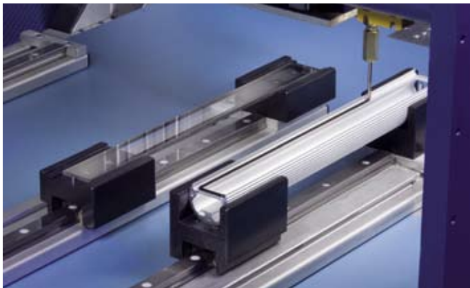
Abb. 7: Das Plasmaverfahren spart nicht nur zwei Arbeitsschritte ein, auch Ablüftzeiten und Zwischenlagerung entfallen. Die Verklebung kann nun unmittelbar nach der Vorbehandlung erfolgen.

Changing from one industrial process to a completely different one is a huge step which calls for a great deal of patience. Especially when the requirements for tight bonds are so high and when – as is the case at Waldmann – the switch to the new pretreatment process is also accompanied by the introduction of a new adhesive. Furthermore, the pretreatment and bonding process was to be tested on three different materials. The housings of the surface-mounted machine lights, which are up to 1.20 metres long, are made from anodized or hard-anodized aluminium. The panels protecting the electronics are made from ceram-