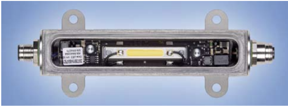
Abb. 5: Bei einem Teil der Waldmann-Leuchten ist die Elektronik bereits in den Alu-Gehäusen verbaut. Um die empfindlichen LED-Baugruppen nicht zu beschädigen, muss die Plasmavorbereitung potentialfrei sein.