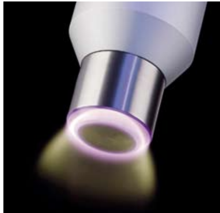
Abb. 3: Zur Vorbehandlung von Bauteilen mit eingebauter Elektronik werden besonders schonend arbeitende Openair-Rotationsdüsen eingesetzt, die potentialfrei und mit bis zu 2.700 Umdrehungen/min arbeiten.

When combined with fixed individual nozzles, this technology enables substrates to be transported through the plasma jet at speeds of several hundred metres per minute. Openair rotary nozzles with a particularly gentle action working at speeds of up to 2,700 rpm are used to pretreat components with built-in electronics. (Fig. 3). The plasma system performs three operations in a single step lasting only a matter of seconds: dry microfine cleaning, electrostatic discharging and activa-